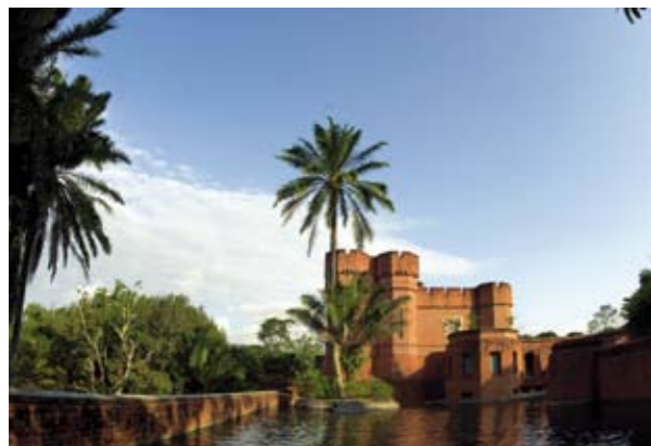
KASTEELMUSEUM Instituto Ricardo Brennand heeft een grote collectie Hollandse kunst

Schoppestad bleef het trieste lot van Olinda bespaard, maar de Nederlanders bouwden wel weer