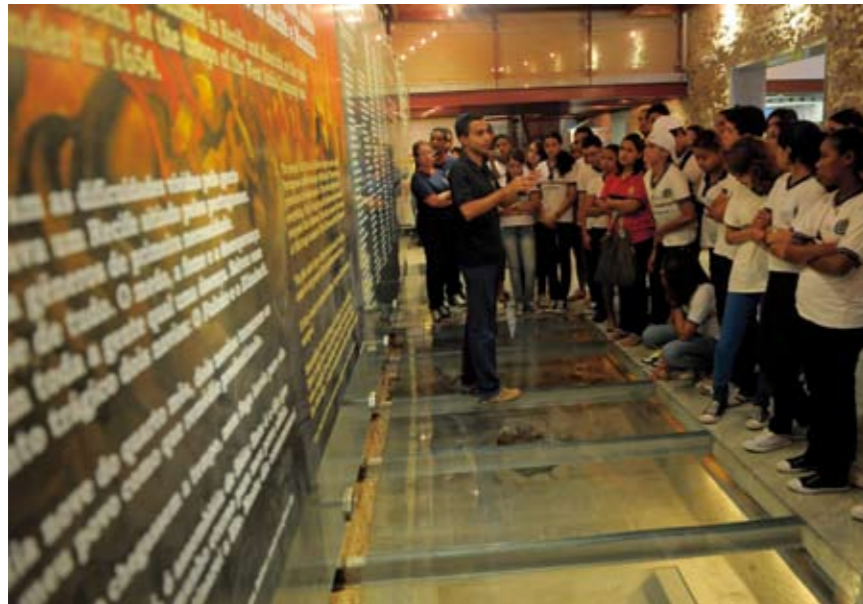
OVERBLIJFSELEN In het Joodse centrum zijn de fundamenten van de synagoge nog te zien

ik net zei. Kijk, je kunt de Hollandse bakstenen nog zien.' Even verderop is een kunstgalerie gevestigd. Binnen is onder een glazen plaat een oorspronkelijke Nederlandse dijk te zien.