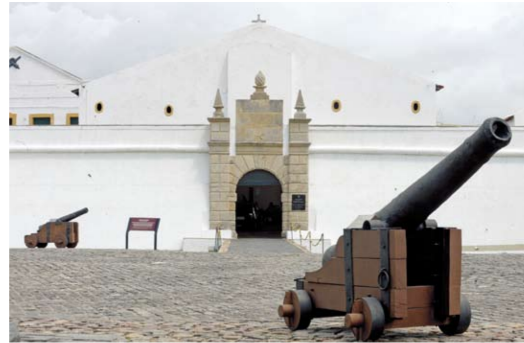
FORT DE BRUYN Het fort werd door de Portugezen herbouwd in steen