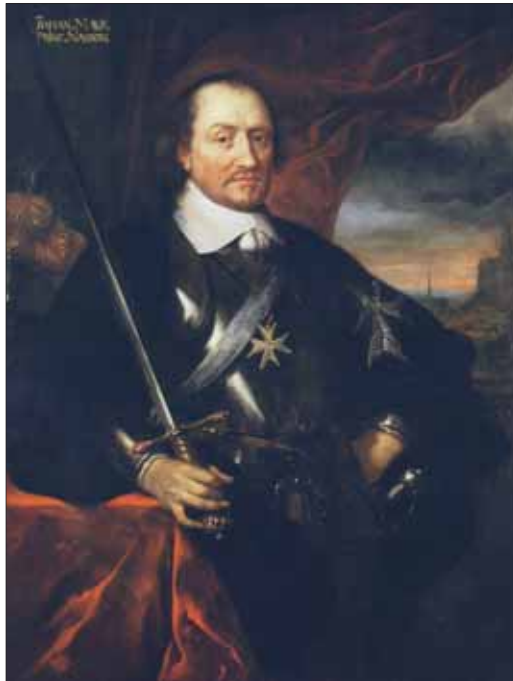
Govert Flink, Portret van Johan Maurits van Nassau-Siegen in 1658

In de loop van de ochtend begint een korte binnenlandse vlucht naar Foz de Iguaçu . We logeren er twee nachten in het wat oudere, maar gezellige parkhotel Carima. 's Mid-