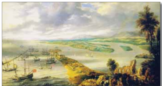
Gillis Peeters, Gezicht op Recife vanaf Olinda , ca. 1640

Wij rijden vandaag naar het 50 kilometer zuidelijker gelegen Recife, de hoofdstad van de deelstaat Pernambuco. Ooit heette deze stad