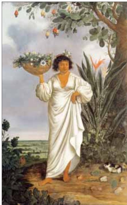
Albert Eckhout, Braziliaanse met een mand bloemen , 1641

Op 10 en 11 april 2008 was de Braziliaanse President Luiz Inácio Lula da Silva in Nederland om te praten over het versterken van de economische banden tussen Nederland en Brazilië. Deze banden gaan al terug tot de zestiende eeuw toen Zeeuwen met indianen in het Amazonegebied handel dreven. Aangetrokken door de hoge opbrengsten van de suikerrietvelden, deden de Nederlanders vervolgens in 1630 een aanval op de Portugese kolonie en hielden tot 1654 een groot deel van het noordoosten van het land in bezit. De Nederlanders noemden deze kolonie, met hoofdstad Recife, Nieuw Holland.